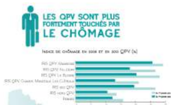
Figure 3 : Graphique sur la situation du chômage au sein des QPV du territoire de Rennes

L'analyse des données exploitées par l'APRAS révèle que l'indice de chômage estimé est nettement supérieur sur les quartiers prioritaires au reste du territoire de la ville de Rennes. Les Iris 59 des QPV enregistrent « un indice de chômage global de 25% contre 13% en France métropolitaine en 2013 » 60 . Ce même indice a atteint en 2023, 27% sur les Iris des QPV Rennais contre 13% sur Rennes.