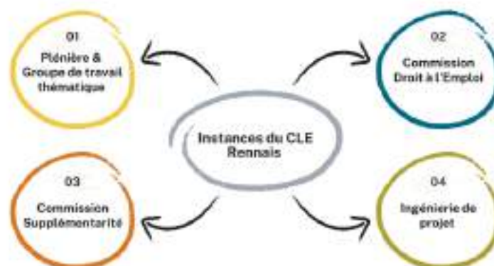
Figure 4 : Les instances du CLE Rennais

Afin d'opérationnaliser le droit à l'emploi sur le territoire, le CLE Rennais a mis en place différentes instances figurant sur l'illustration suivante :