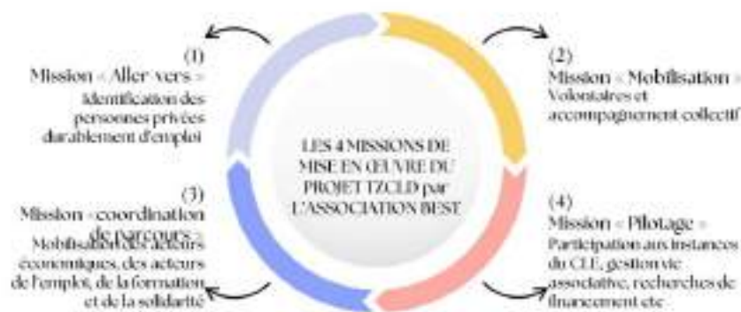
Figure 5 : Les quatre missions pour la mise en œuvre du projet TZCLD par l'association BEST

Sources : Construction personnelle sur base du compte-rendu CLE du 7 février 2025