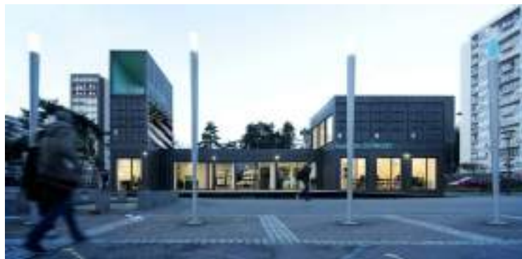
Figure 6 : Photo de la Maison du Projet _ siège de l'association BEST

Source : Maison du Projet située au sein du QPV Le Blosne. Photo prise lors d'un temps d'observation du terrain de recherche